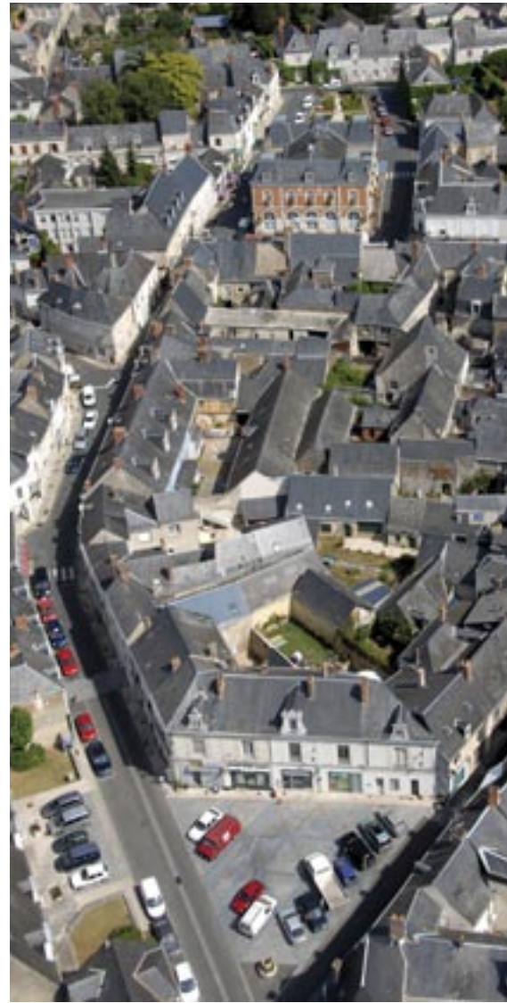
Le Lude, le cœur de ville et les jardins du château